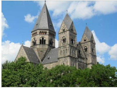
Le Temple Neuf