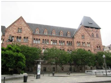
L'Hôtel des Postes