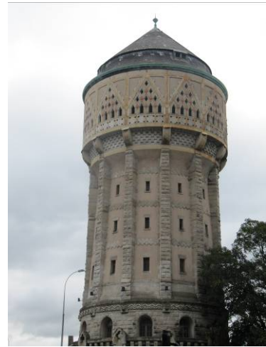
L'ancien château d'eau