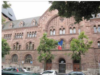
L'Hôtel des Postes