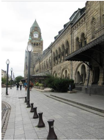
La gare de Metz