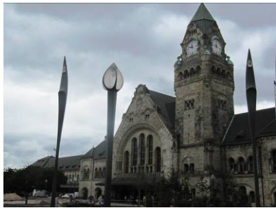
La gare de Metz