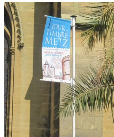
Fanion annonçant le congrès