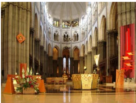
Le chœur réaménagé en 1999

La façade principale a été inaugurée en 1999. Conçue par l'architecte Pierre-Louis Carlier, elle est totalement indépendante du reste de l'édifice. Sa partie centrale est composée d'une ogive de 30 mètres de haut, tapissée de 110 plaques de marbre blanc de 28 millimètres d'épaisseur, que soutient une structure métallique de Peter Rice.