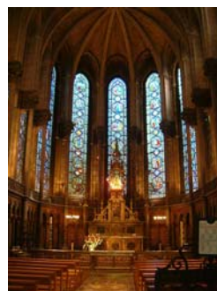
La Sainte Chapelle