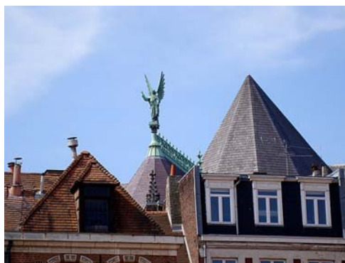
L'archange Gabriel de l'abside domine les toits du Vieux-Lille