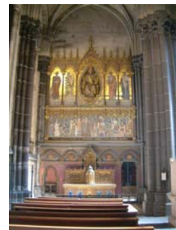
La chapelle du Sacré-Cœur de Jésus