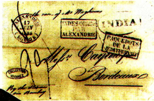
Lettre de Bombay à Bordeaux via Suez, Alexandrie, Malte, Marseille (cachet du 17.06.1838). On distingue deux entailles verticales, prouvant sa purification.